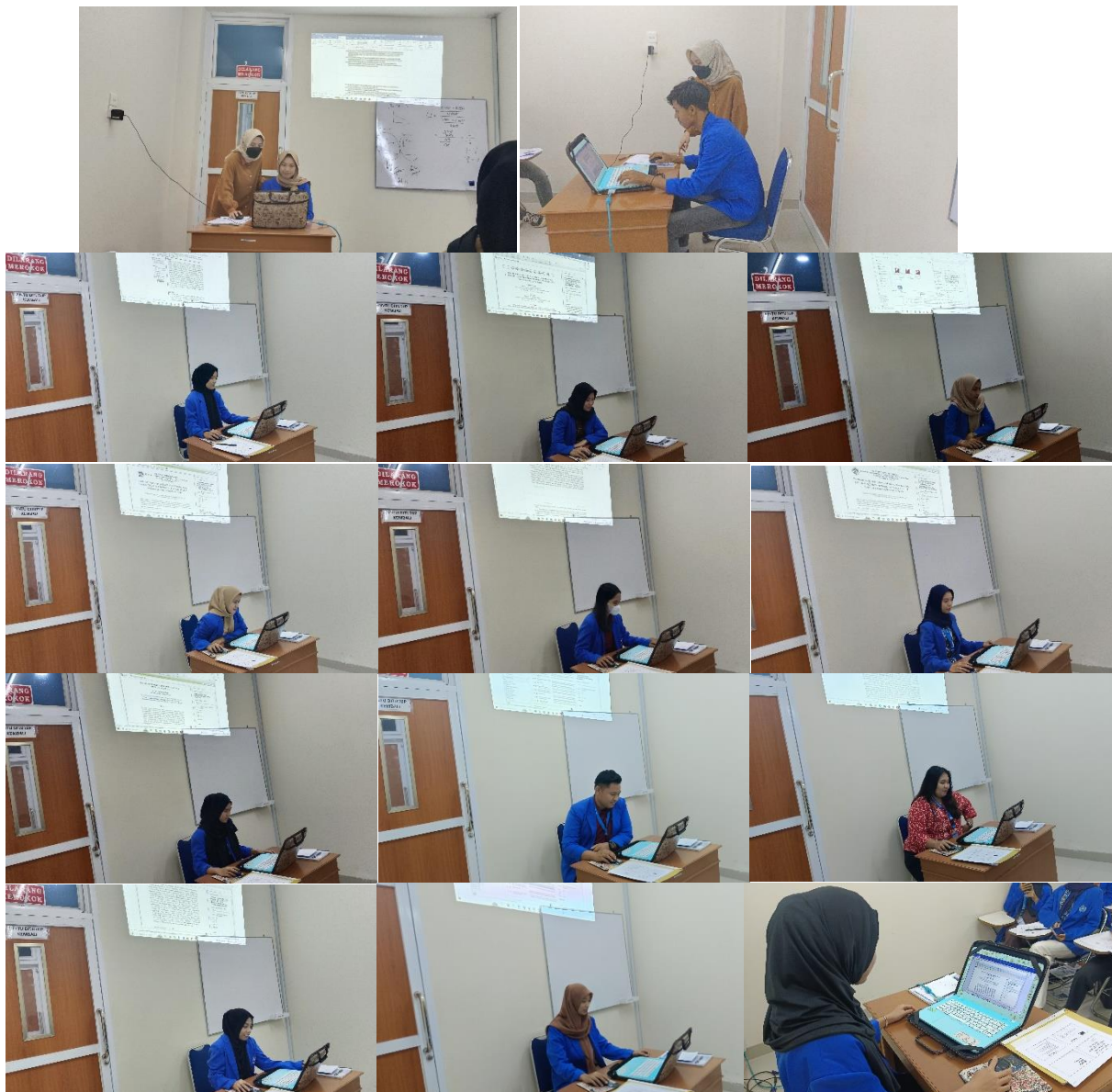
Gambar 4. Mahasiswa Praktik Menggunakan Aplikasi Mendeley

Diakhir kegiatan, pada gambar 5, Dosen dan mahasiswa foto bersama. Pada pelatihan ini, mahasiswa sangat antusias dan memberikan respon yang positif.