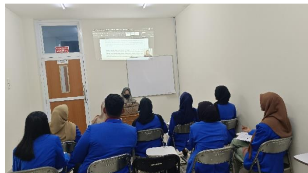
Gambar 3. Sesi Tutorial Instalasi Aplikasi Mendeley dan Dosen Praktik cara Menggunakan Aplikasi Mendeley

Selanjutnya pada gambar 4, mahasiswa satu per satu mempraktikkan cara menggunakan Aplikasi Mendeley yang sebelumnya sudah dipraktikkan oleh Dosen. Mahasiswa mendownload salah satu jurnal online, kemudian menginput jurnal tersebut kedalam aplikasi, melengkapi data jurnal dan bagaimana memunculkan refrensi tersebut pada daftar pustaka.