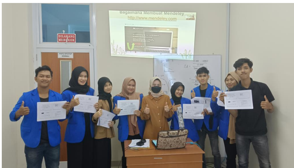
Gambar 5. Foto Bersama