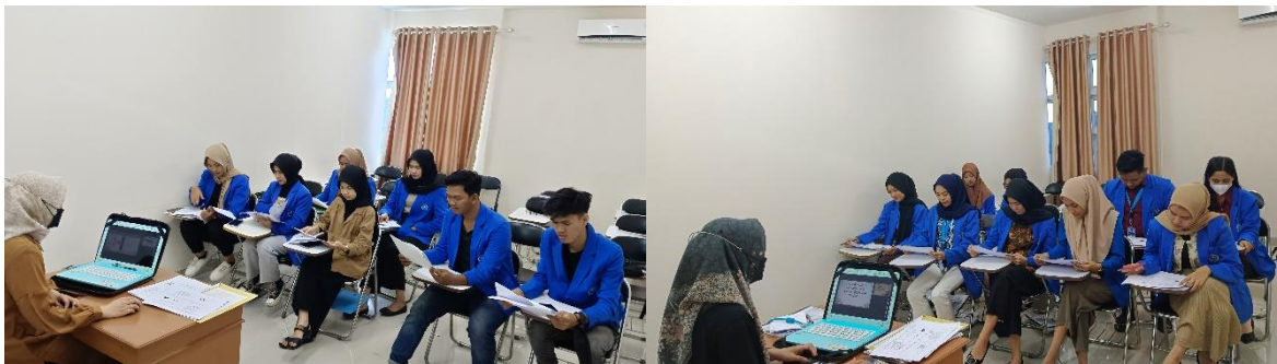
Gambar 1. Pembukaan Pelatihan

Kegiatan pelatihan ini dibuka dengan memperkenalkan dosen tim pengabdian dapat dilihat pada gambar 1. Pada sesi awal ini juga mahasiswa mengisi daftar hadir dan menerima hardcopy materi yang telah disiapkan dosen tim pengabdian.